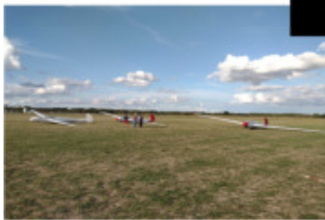
Flugbetrieb bei Hammerwetter