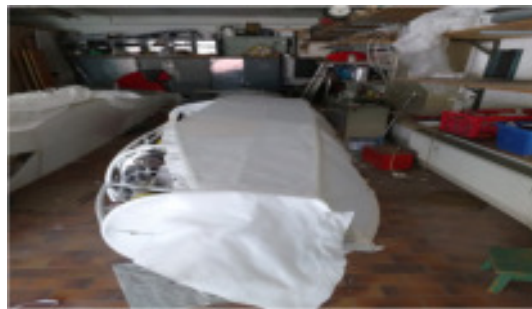
Linke Rumpfseite fast bespannt