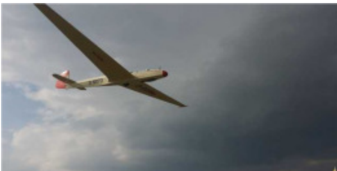
Das Zeltlager in Stendal Kranichtreffen