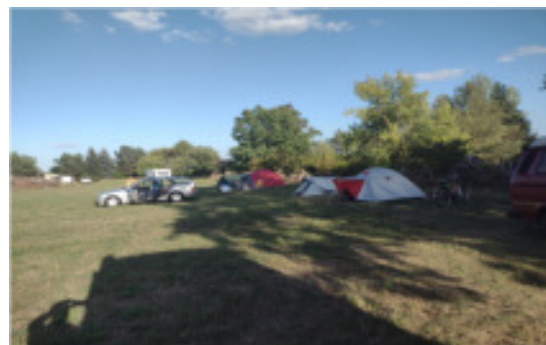
Kranich 3 D – 6073 im Flug über Stendal

Auch die Organisation für mein Olditreffen 2022 musste daher nebenher erledigt werden.