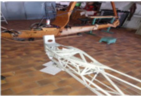
Rumpfgerüst vor dem bespannen

Der Rumpf von dem Kranich 3 war noch in der Werkstatt und wurde noch bespannt und lackiert.