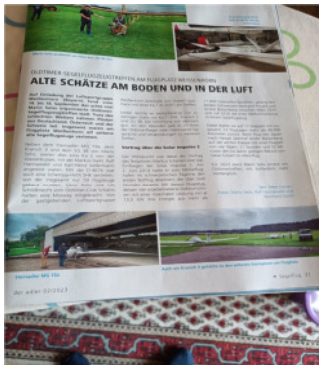
Bericht im Adler über das Olditreffen 2022