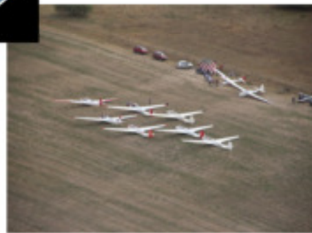
Startaufstellung 7 Kranich 3