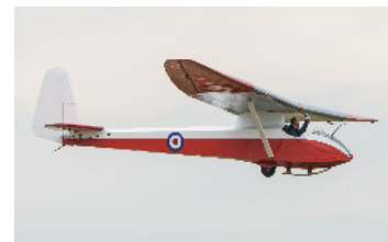
Slingsby T 21