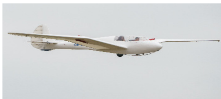
MG 19a Steinadler

12 verschiedene, seltene, historische Flugzeuge, Konstruktionsjahre 1938 bis in die sechziger Jahre waren am Start.